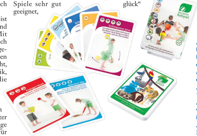
„Das kleine Fußballspiel, Das kleine Motorikspiel und Das kleine Ballspiel“, von Christina Kist für einen bis mehrere Spieler im Alter ab drei Jahren, Spielzeit etwa 5 bis 30 Minuten, Verlag „Das kleine Förderspiel“, etwa 12 Euro.

oder auch Restaurantspiel besteht aus spannenden Malblöcken, Getränkedeckeln, Farbstiften und Spielideen, die nur mit Münzen funktionieren. Die Kinder können Raketen gestalten, ihre eigene Torte entwerfen oder sie zeichnen das Menü, das sie essen wollen. Bei uns hatten besonders die Kinder zwischen drei und acht Jahren viel Spaß, wobei auch unsere zwölfjährige selbstverständlich eine eigene Torte kreieren wollte. Auch für Kindergeburtstage ist das Set super geeignet.