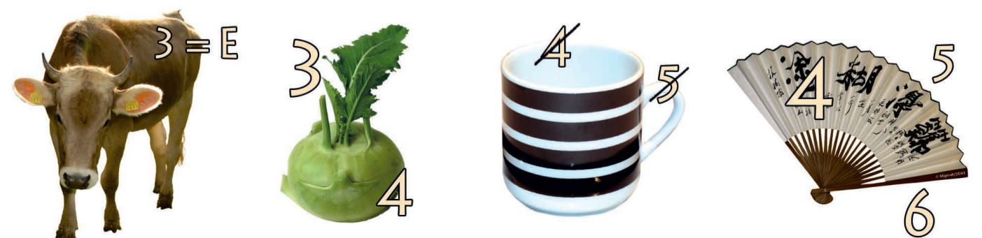
Auflösung zu „Der Schutzengel-Schreck“: Sandra Bullock, US-amerikanische Schauspielerin, * 26. Juli 1964 Arlington/Virginia Auflösung Rebus: Kucheltasche